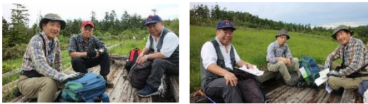
横田代のベンチで小休止。静寂と清浄な空気、風景の中、水分とエネルギー源を補給する。