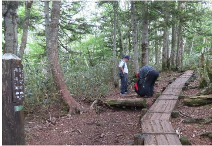
鳩待峠から2.3kmの標柱のあるところで小休止。地図にある中ノ原か。