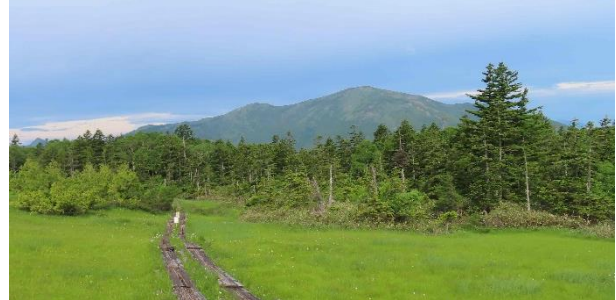
しばらく田代の中を歩いて、そして、振り返ればこの景色。明日登る至仏山がデーンと聳えている。