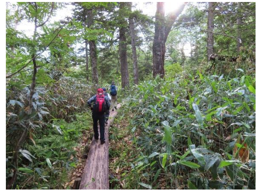
静かな樹林帯を行く。今日、この道を行くのは先行した二人組のほか、我々のみ。