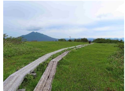
アヤメ平を離れて富士見田代に向かう。写真を撮り忘れたが、傾斜した木道には網状のゴムが貼られており、足を滑らせることはなさそうで、安心して歩くことができた。