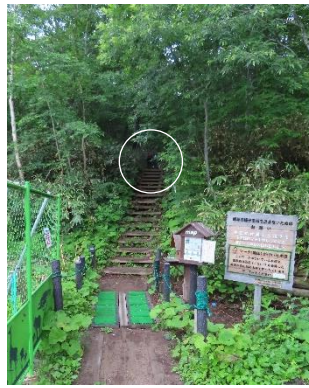
鳩待峠休憩所の裏手に、鳩待通りの登山口がある。

22時にバスタ新宿で集合し、夜行バスで尾瀬戸倉に翌日4時過ぎに到着。鳩待峠行きシャトルバスを待つ間に、朝食。5時30分にバスに乗り、鳩待峠には6時前に着き、身支度を整えて歩き始めました。