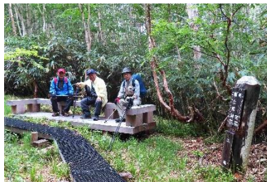
緩やかな下りが続き、土場に着いた。ベンチで小休止。気持ちの良い山道だったが、この後、距離約700m、標高差約230mの段差の大きい下りの急坂があって、苦労した。