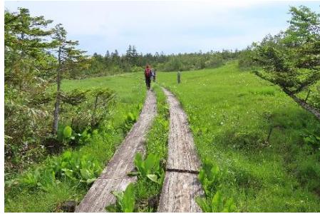
樹林帯を抜けて急に開けた。明るくて気持ち良い。横田代に到着したようだ。