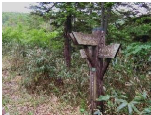
富士見田代の分岐点。まっすぐ行けば富士見峠。左に折れて竜宮へ下る。