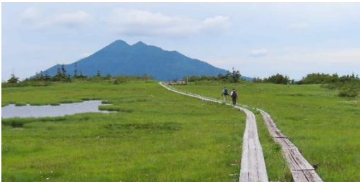
アヤメ平に着いた。「天空の楽園」と呼ばれていて、360°の景観が広がる場所。